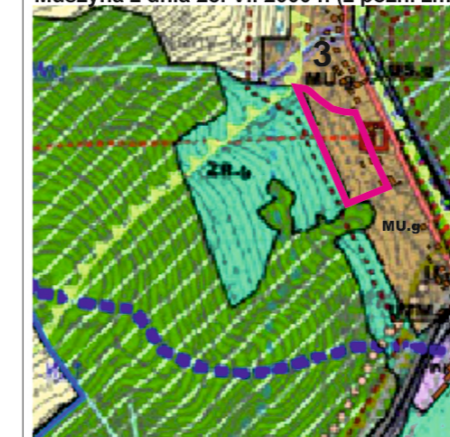
Wrys ze studium uwarunkowań i kierunków zagospodarowania przestrzennego Miasta i Gminy Uzdrawiskowej Muszyna, uchwalonego uchwałą Nr XIX/181/2000 Rady Miasta i Gminy Uzdrawiskowej Muszyna z dnia 28. VI. 2000 r. (z późn. zmianami)