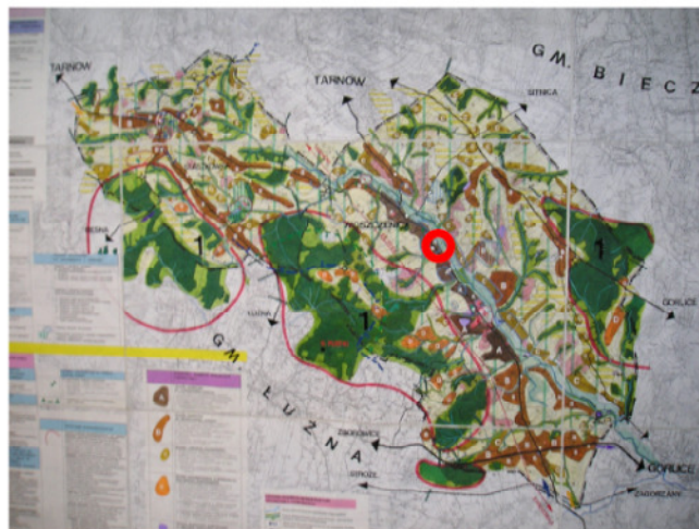
WYRYS ZE STUDIUM UWARUNKOWAŃ I KIERUNKÓW ZAGOSPODAROWANIA PRZESTRZENNEGO GMINY MOSZCZENICA

TERENY ZAGROŻONE ZALEWANIEM WG OBO- WIAZUJĄCEGO PLANU Z 2005 r.